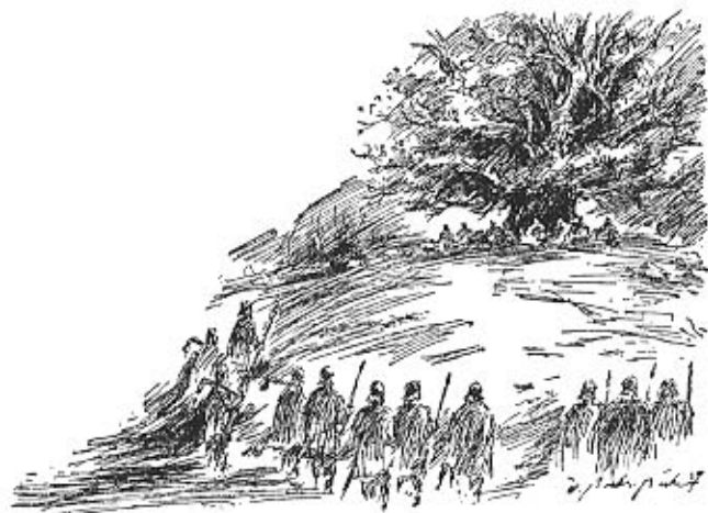
Thing: Die Versammlung der germanischen Freien

Es ist erstaunlich, daß diese Meinung noch heute mehr oder weniger bewußt in den Gehirnen zahlloser Volksgenossen verankert ist, obwohl die vorgeschichtliche Forschung durch Ausgrabungen schon seit länger als einem Jahrzehnt das Gegenteil bewiesen hat. Wir haben freilich keine schriftliche