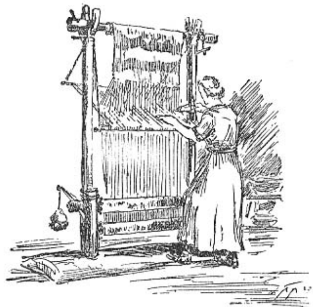
Nordische Frau am Webstuhl

Von den beiden ältesten Funden von Flachs, die etwa aus der Zeit um 3000 v. d. Z. stammen, wurde der eine in Aegypten und der andere in Dänemark gemacht. Der ägyptische Fund war früher bekannt als der dänische. Infolgedessen sah man darin einen weiteren Beweis für die Behauptung, daß alle Kultur aus dem Osten und Süden zu uns nach Norden ge- kommen sei. Jetzt wissen wir, daß unsere Vor- fahren die Verwendbarkeit und den Anbau des Flachs aus eigener Kraft gefunden haben. Die Aegypter waren nicht tatkräftig genug, um den Flachs und damit das Leinen wesentlich zu ver- breiten. Um 900 v. d. Z. war das Leinen in Griechen- land trotz der Handelstätigkeit der Phönizier noch unbekannt, und um 550 v. d. Z. kannten die Be- wohner Siziliens das Leinen immer noch nicht. Der große Weise Pythagoras war noch gezwungen, wollene Kleider zu tragen. Die nordische Rasse aber verbreitete die Kenntnis vom Flachs und das Weben von Leinen durch ganz Mitteleuropa. Schon um 2000 v. d. Z. muß diese Kulturpflanze bei Bern- burg, um 1880 in Oberschwaben bei Buchau, um