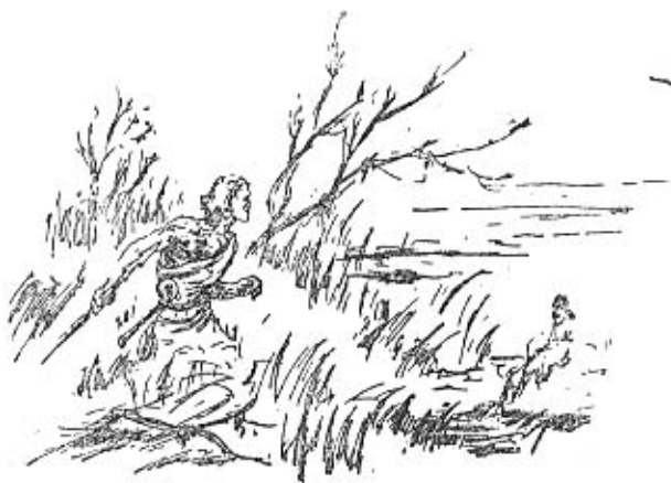
Nordischer Jäger auf der Renttierjagd in

also über die naturnachbildende Kunst hinaus das lineare, „denkerische“ Ornament, das bis heute nicht ausgestorben ist, sondern einen wesentlichen Teil der menschlichen Kunst überhaupt darstellt.