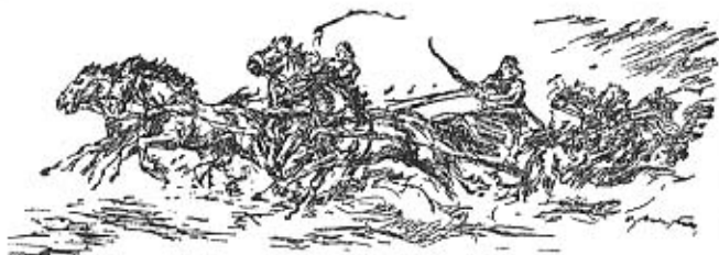
Ein Wagenrennen, wie es bei den Germanen vor mehr als 3000 Jahren üblich war

lichen Macht oder ihrer großen Toten veranstaltet. Kampfspiele mannigfaltiger Art hat es sicher schon bei den Indogermanen gegeben, und mit ihnen wanderte die Sitte über weite Teile der Erde. Bilder und Funde bestätigen uns solche Wagenrennen für eine Zeit, die rund 1000 Jahre vor der Gründung Roms liegt. Es sind sogar uralte Rennbahnen gefunden, die von nordischen Menschen angelegt waren. In der Nähe des Sonnentempels von Stonehenge in England wurde schon vor langer Zeit eine solche Rennbahn erkannt. Neuerdings ist eine zweite in der westfälischen Senne westlich des Teutoburger Waldes festgestellt worden. Beide müssen aus der ersten Hälfte des 2. Jahrtausends v. d. Z. stammen. Außerdem gibt es mehrere andere Spuren solcher Kampfspielplätze. Die Pferdezucht ist in Hannover und Westfalen sicherlich mehrere Jahrtausende alt. Und nicht umsonst galt dieses Tier, wie wir von dem römischen Schriftsteller Tacitus wissen, bei unsern Vorfahren als heilig.