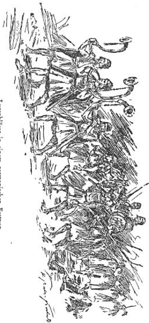
Lurenbläser in einem germanischen Festzug

heute Lieder gesungen werden, oder rhythmische Rufe, und sei es auch nur „hau ... ruck“, ertönen.