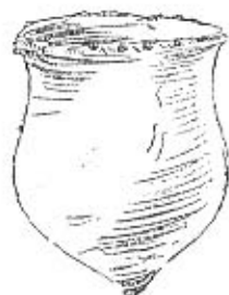
Das älteste nordische Ton- gefäß — Mittlere Steinzeit 6. bis 5. Jahrtausend v. d. Z.

tausenden von Austernschalen . Dazwischen finden sich auch die Gräten von Fischen oder die Ueber- reste von Knochen der auf der Jagd erlegten Tiere und Vögel. In diesen oft sehr großen und ausge- dehnten Küchenabfallhaufen fanden die Forscher nicht nur die ältesten Topfscherben, sondern auch die Skelettreste des ältesten Haustieres der Mensch- heit, des Hundes .