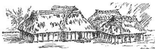
Germanischer Bauernhof um 400 v. d. Z.

In der Weiterentwicklung entstand daraus das rechteckige Pfostenhaus mit steilem Satteldach und mit einer offenen Vorhalle. Sehr bald erfolgte eine Einteilung in zwei oder mehr Räume, meist jedoch in zwei. In dem Küchenraum befand sich vielfach ein gut gebauter Backofen, während der offene Herd im Wohnraum lag. Dieses entwicklungsfähige Rechteckhaus wurde von den nordischen Indo-