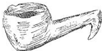
Schöpfkelle aus Holz Jüngere Steinzeit — 3. Jahr- tausend v. d. Z.

Die Küchenabfallhaufen, die sich an der Ostsee- küste fanden, hauptsächlich in Schleswig-Holstein, Jütland und auf den dänischen Inseln, sind die Ueberreste der Mahlzeiten vieler Generationen. Sie bestehen hauptsächlich aus Tausenden und Aber-