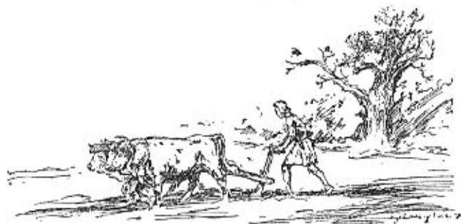
Nordischer Bauer beim Pflügen vor 5000 Jahren

nennt. Es sei noch erwähnt, daß sie die Kraft des Oeles enthält.“ An einer anderen Stelle bezeichnet derselbe Gelehrte die Butter als „die feinste Speise barbarischer (germanischer) Völkerschaften“. Vom Rettich sagt er, daß er in Germanien die Größe von kleinen Kindern erreicht, und über den Spargel erzählt er, daß ihm von allen Gewächsen in den Gärten die vornehmste Sorge gilt.