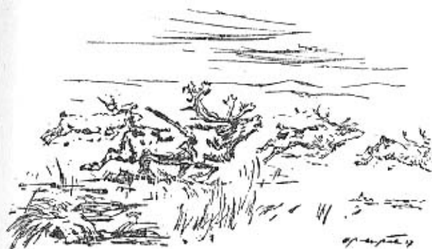
Schleswig-Holstein vor 20 000 Jahren

Erst vor einigen Jahren gelang es einem Nichtfachmann, einem Elektrotechniker, der ein Lieb-