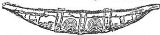
Goldenes Boot aus dem Weihefund von Nors in Jütland 2. Jahrtausend v. d. Z. = germanisch

Insel Bornholm wurde zwischen 8000 und 7000 v. d. Z. von den kühnen Seefahrern angesteuert und besiedelt. Die Insel Gotland, die vom skandinavischen Festland noch weiter entfernt liegt, muß etwa zur gleichen Zeit den ersten Besuch von Menschen erhalten haben, denn die Vorgeschichtswissenschaft