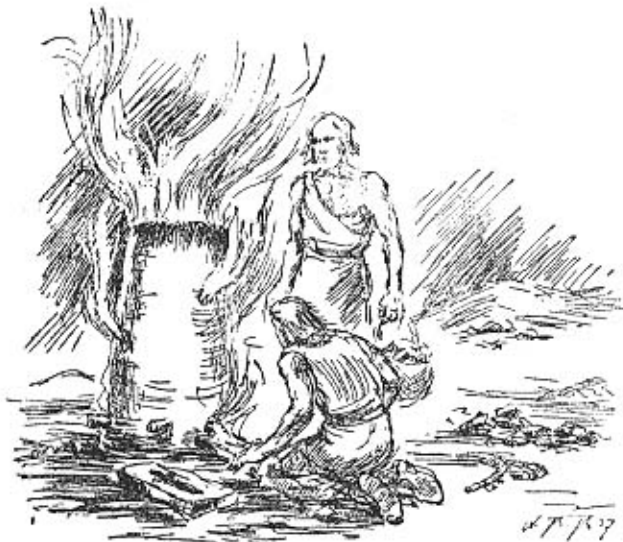
Germanische Bronzegießer bei der Arbeit 2. Jahrtausend v. d. Z.

lebten die Handwerker in den großen Dörfern oder wanderten über Land, sei es, um fertige Erzeugnisse an die Bauern zu verkaufen, sei es, um zerbrochene Gegenstände einzuschmelzen und neue aus dem Metall zu fertigen. Das Handwerkszeug, ein kleiner Amboß, einige Hämmer und Meißeln, ließ sich leicht mitführen.